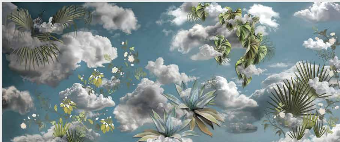
Papier peint panoramique Heaven Green

HEAVEN GREEN , « grand panorama, se déroulant sur un papier peint de plus de six mètres de long, qui associe l'Olympe à la luxuriance d'une Amazonie fantasmée, propice à la rêverie, ce dessin se développe ensuite sur deux tapis moelleux aux formes libres évoquant, cette fois de façon plus candide, les nuages qui courent sur le dessin qu'ils illustrent » ou encore