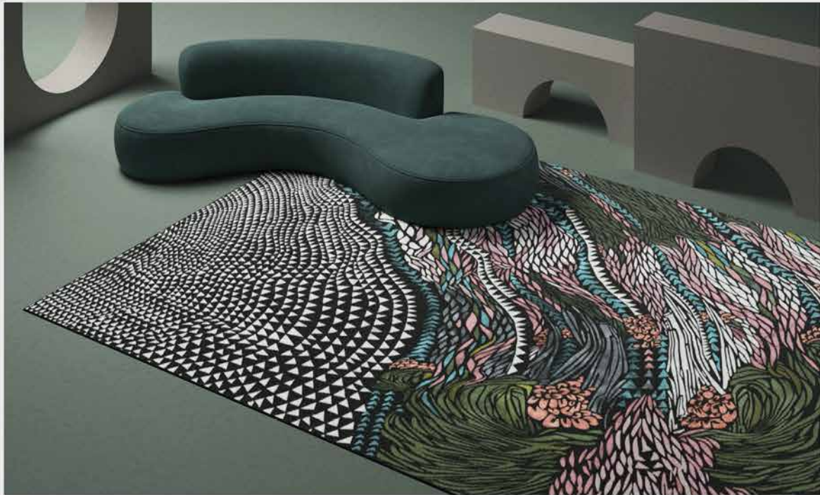
Tapis Wild Vibrations