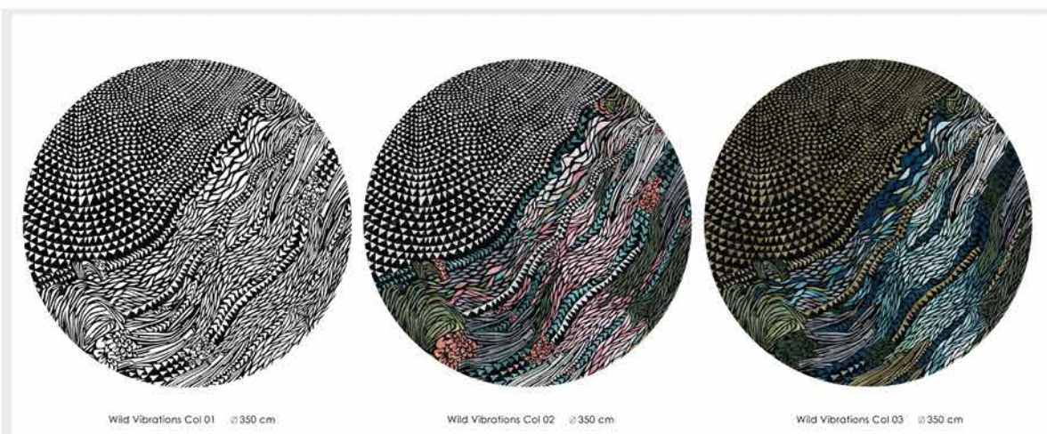
Wild Vibrations_Cicle Carpet