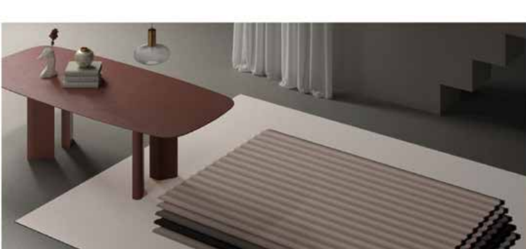
Tappeto Stacked Up di Alain Gilles Alain Gilles

La terza linea della collezione si chiama Stacked-up e converte un elemento grafico trascurabile in un dettaglio interessante. Rivisita, con ironia, il tema della ripetitività e con uno schema di stratificazione trasforma un'immagine di natura bidimensionale in un'immagine di natura tridimensionale. Questa linea si concentra sull'illusione ottica: "Il design dà l'impressione che la pila di lamiera ondulate al centro del tappeto sia reale, che abbia una profondità", ha dichiarato il designer, "questo effetto varia a seconda dell'angolo da cui lo si guarda. Le ombre create dai pezzi impilati diventano un elemento grafico molto importante del tappeto e sono addirittura al centro della scena nella versione in cui la composizione è decentrata".